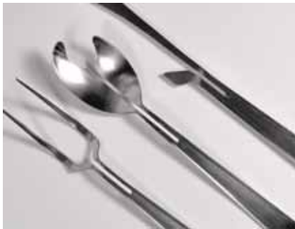
Avi Fedida ve Bar Roman Çatal Bıçak Takımı

I examine my face, follow the wrinkles I have and the ones I will have, like a personal astrological chart determined at birth, and fill it with golden threads. Thread after thread, the cracks are filled until the full mask is created. Jewellery collection: necklace for the neck, tiara for the forehead, eye jewellery and cleavage jewellery, transforming into a fashion accessory that is meant to beautify, emphasise the flaw and celebrate its existence.