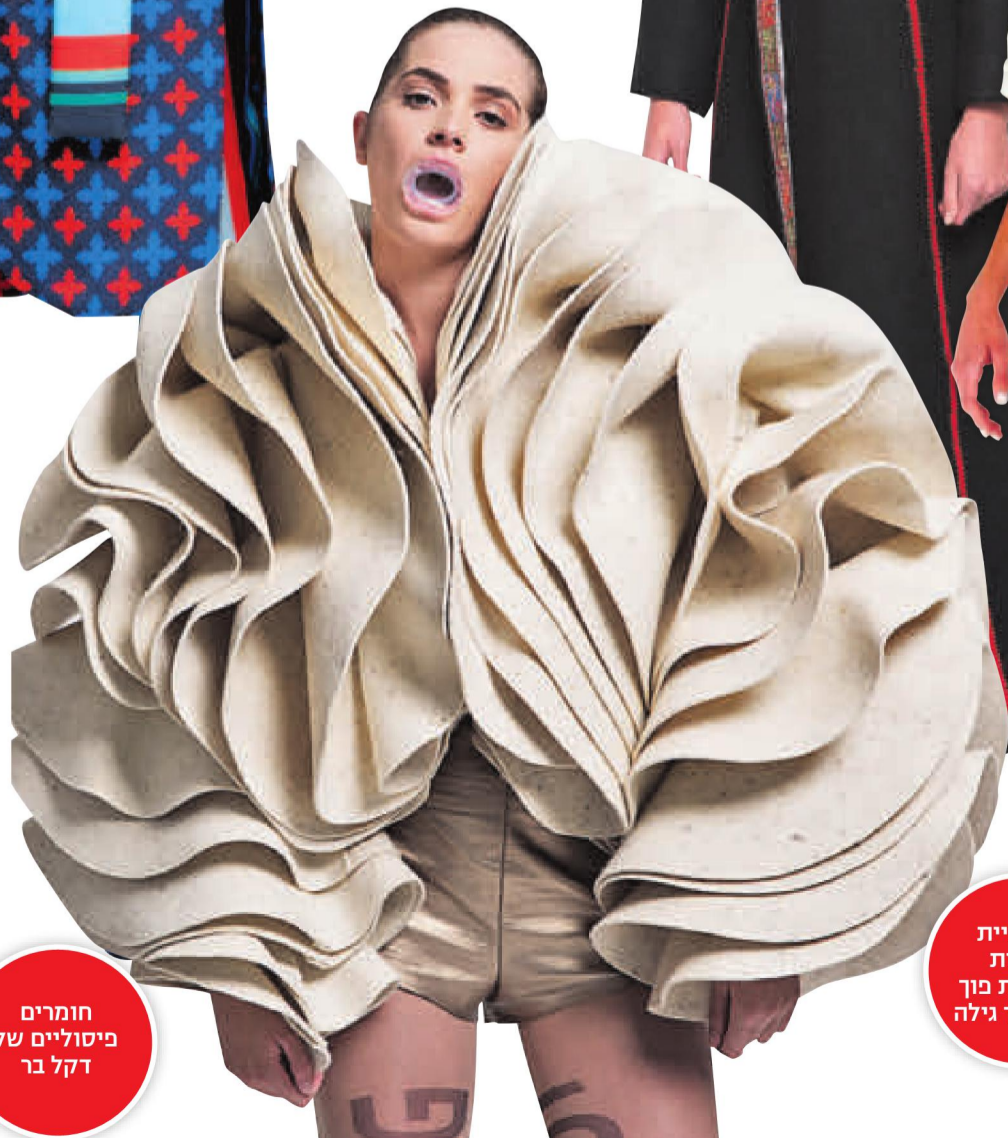
חומרים פיסוליים של דקל בר