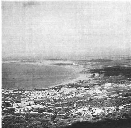
שטח הטכניון לאחר הגידור. בפינה העליונה, מגדל המים

משנקבע מקומו של הטכניון, נעשה מאמץ מיוחד לרכוש קרקע ולבנות מסביב, כדי למנוע את בידודו של המוסד - עשייה שהיא למעשה הבסיס של הדר הכרמל. הבנייה המואצת החליפה את מבני המגורים הארעיים, בעיקר את האוהלים והצריפים שהיו מפוזרים בשטח, וספחה אליה את השכונות מיצפה, יחיאל, נחלה, המעיין, ועוד שמות נשכחים.