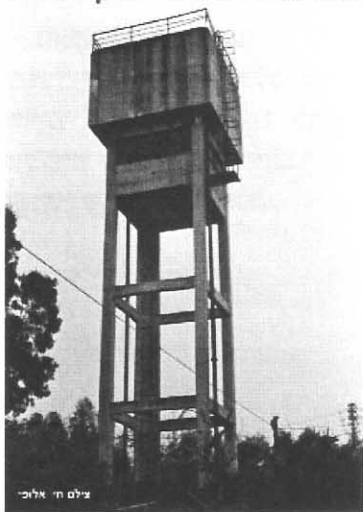
מגדל המים ההיסטורי של קרית חיים

על גבעת החול היינו אוספים תרמילי "טו-טו" (קוטר 0.22 אינץש) לוחטים מיד כשנפלטו מבית הבליעה, וקשה להבין איך יצאנו רק עם חור אחד בישבן כשהתרוצצנו בין לועי הרובים העשנים. משם פנינו אל פסי הרכבת, עליהם היינו מניחים מטבעות של מיל או שני מיל, וגלגלי הרכבת היו רוקעים אותן לדיסקיות דקות ומעוקלות. כאשר אספנו אותן מבין הפסים הן היו עדין חמות.